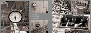
■ 可動水管供320試驗，確保日後使用不滲水。